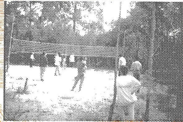
Parque natural para juegos y dinámicas Cancha de Voleibol