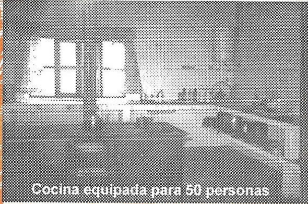
Cocina equipada para 50 personas