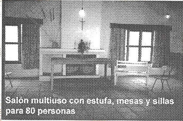
Salón multiuso con estufa, mesas y sillas para 80 personas